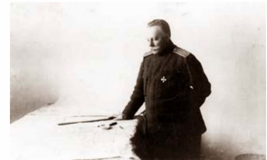
Рис.2. Генерал-лейтенант М.И. Шишкевич. Фотография периода Первой мировой войны