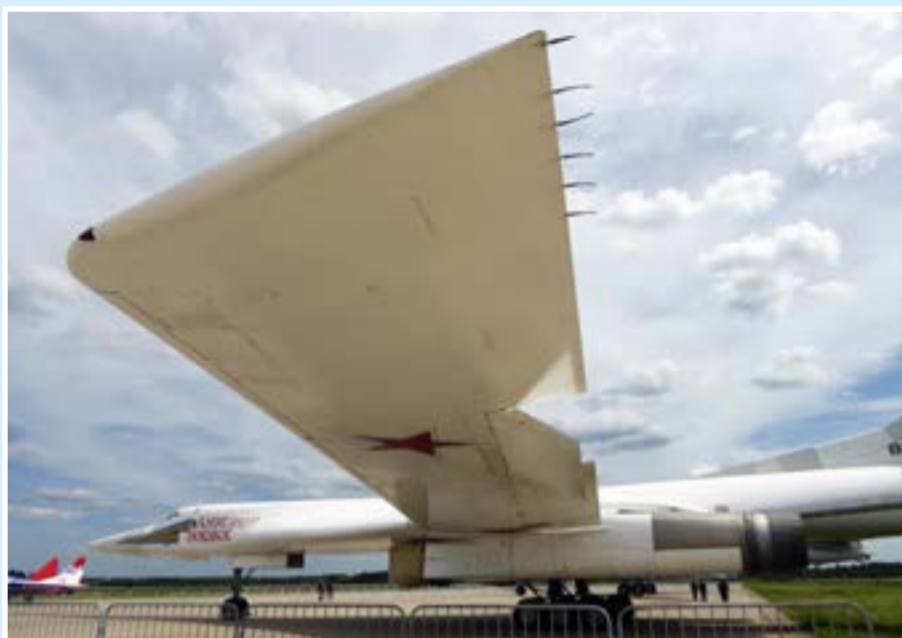
Ту-160 на линейке выставки