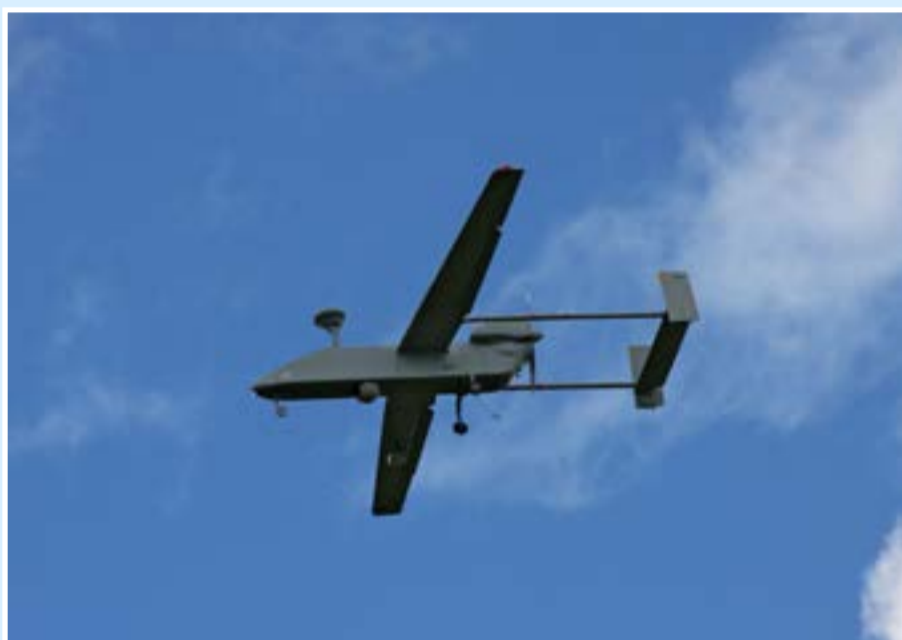
Беспилотник «Фортост» приземляется в Кубинке