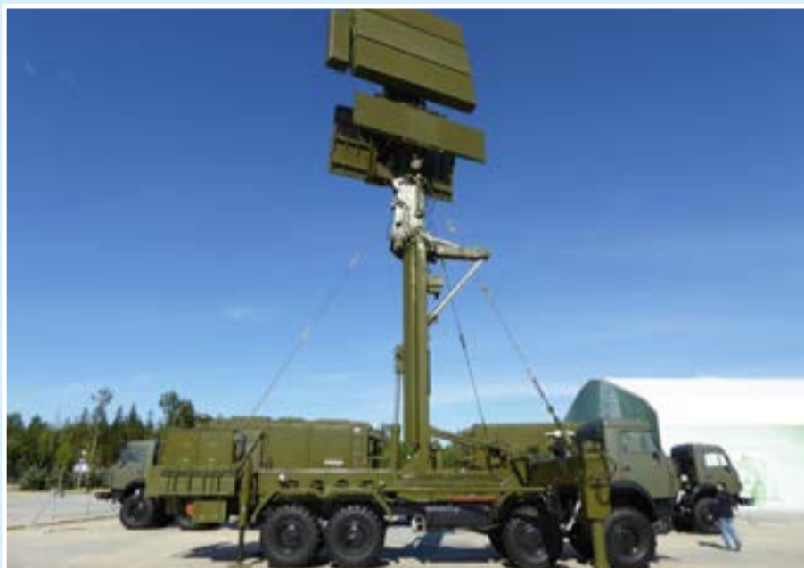
Новейшая РЛС обнаружения маловысотных целей 48Я6-К1 «Подлет»