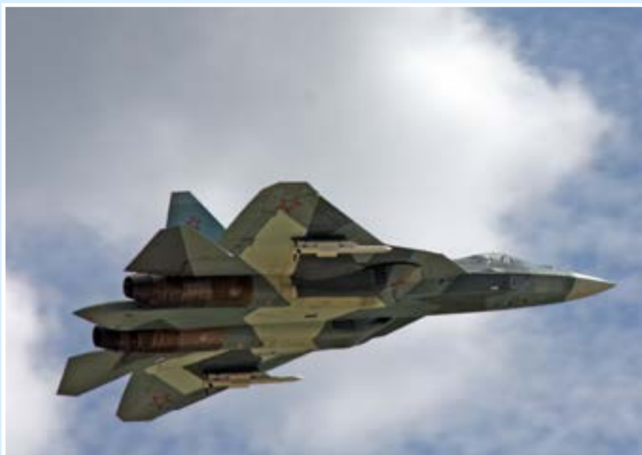
Т-50 впервые в небе Кубинки