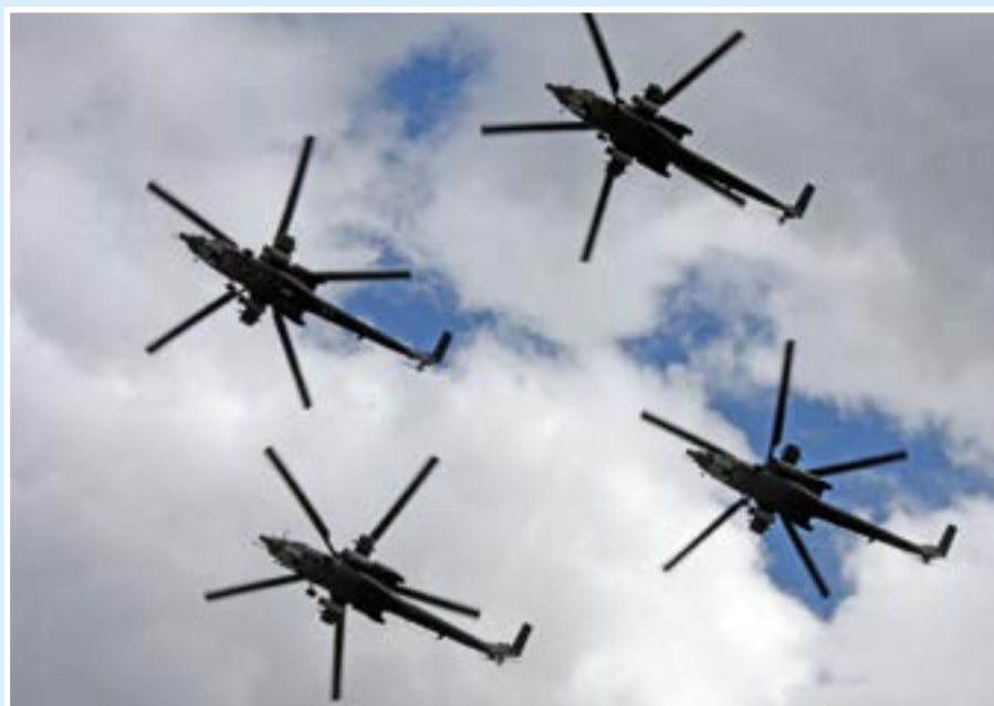
Групповой пилотаж боевых вертолетов Ми-28