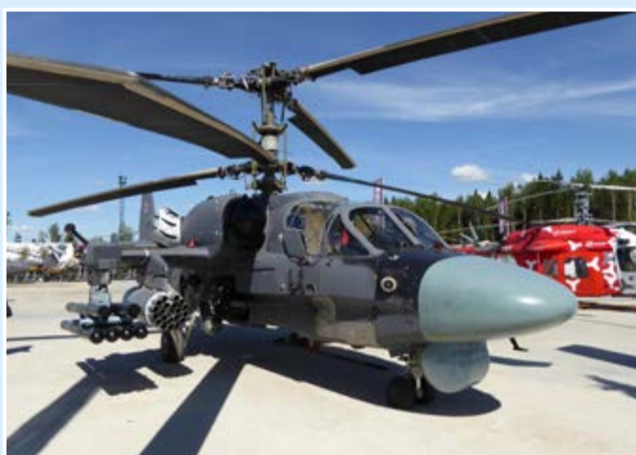
Новейший корабельный вертолет Ка-52К