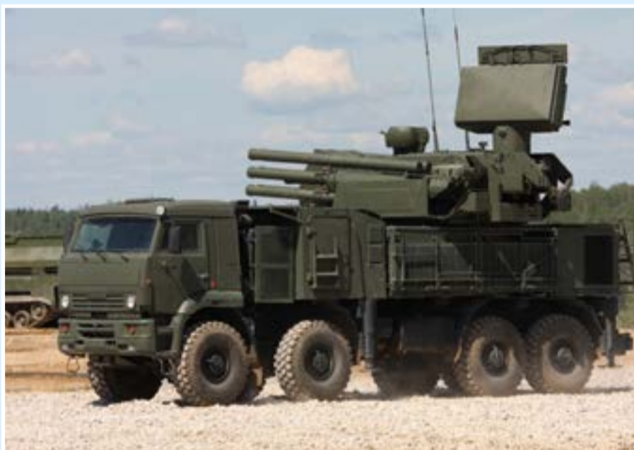
ЗРПК «Панцирь-С» выдвигается в точку стрельбы