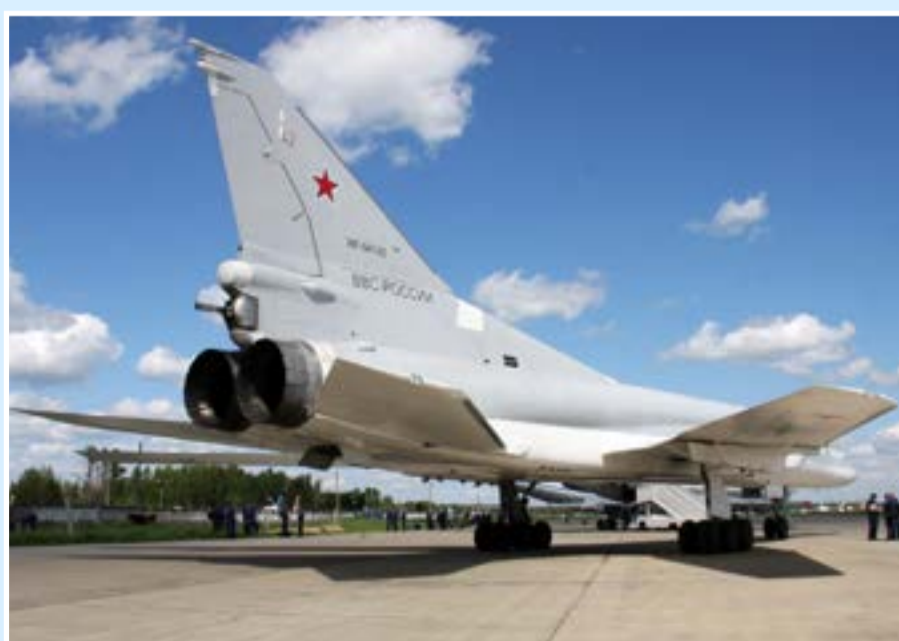
Ту-22М3 после посадки в Кубинке