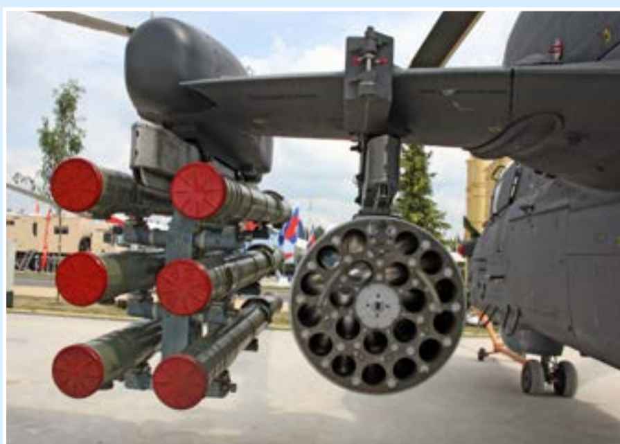
Вверху виден узел складывания крыла Ка-52К