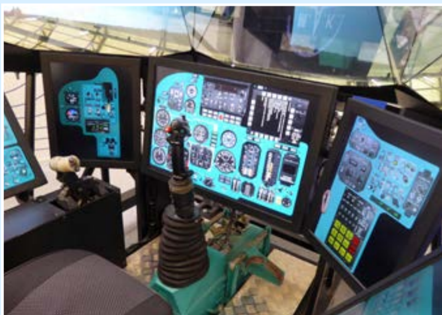
Тренажер многоцелевого самолета МиГ-31БМ