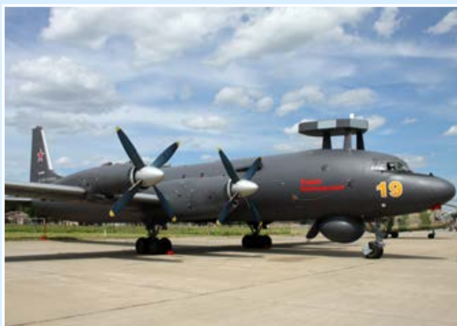
Модернизированный противолодочный самолет Ил-38Н