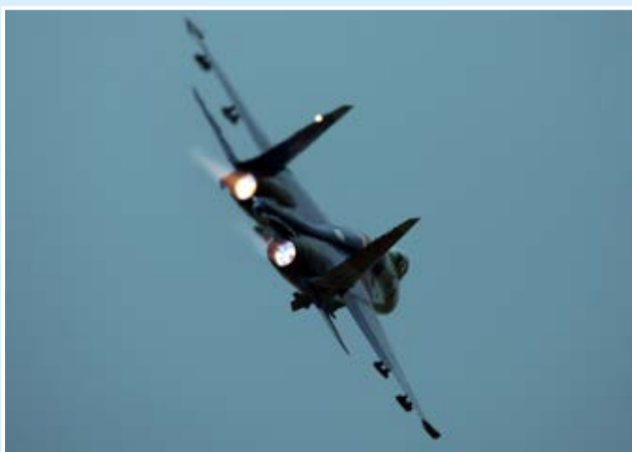
В день закрытия Форума полеты начались ближе к вечеру