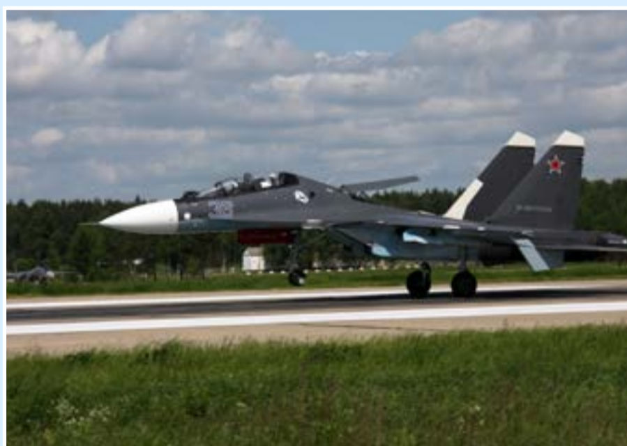
Су-30СМ морской авиации ВМФ РФ, базирующийся в Крыму на аэродроме Саки, приземляется в Кубинке