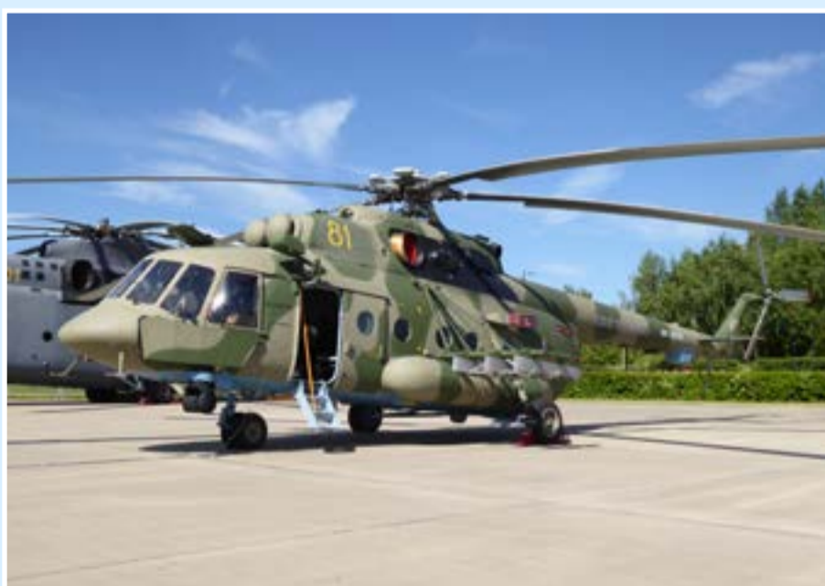
Ми-8АМТШ на линейке выставки