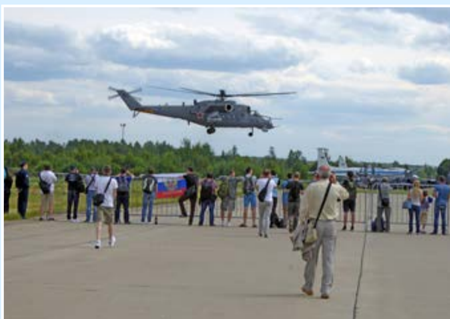
Зрителей подпускали довольно близко к ВПП