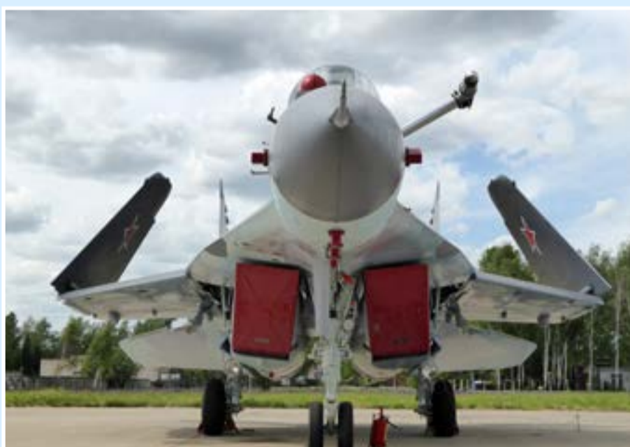
Корабельный МиГ-29КУБ МА ВМФ России на линейке выставки в Кубинке